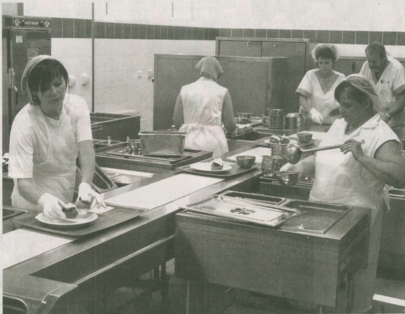
UŽ TO JEDE. Práce na vydávací lince zabere personálu kuchyně zhruba tři čtvrtě hodiny.

Jídelna vypadá sympaticky. Je hodně prosluněná, pěkně upravená a nabízí výhled na českokrumlovský zámek. „Jsme schopni zajistit stravu i pro jednotlivce z řad veřejnosti či třeba nějaké organizace. Stačí se jen ozvat. Oběd