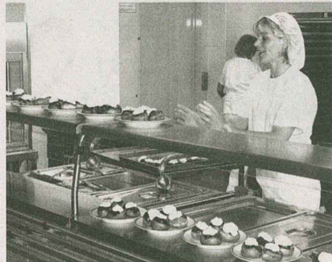
V JÍDELNĚ. Bavorské vdolečky už čekají na první strážníky. Ti už stáli netrpělivě za zavřenými dveřmi.