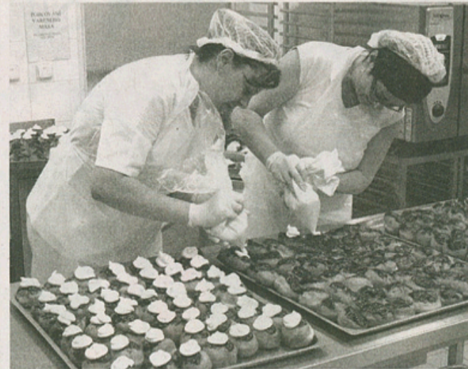
NENUDÍ SE. Personál nemocniční kuchyně připravuje zhruba 450 jídel denně.