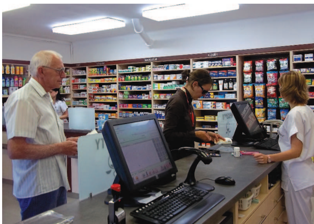
LÉKÁRNA V ČESKÉM KRUMLOVĚ. Také českokrumlovskou lékárnou v areálu nemocnice brzy potkají změny – přestěhuje se do nového pavilonu.

„Město adaptuje prostory a současně už je vše schváleno i Státním ústavem pro