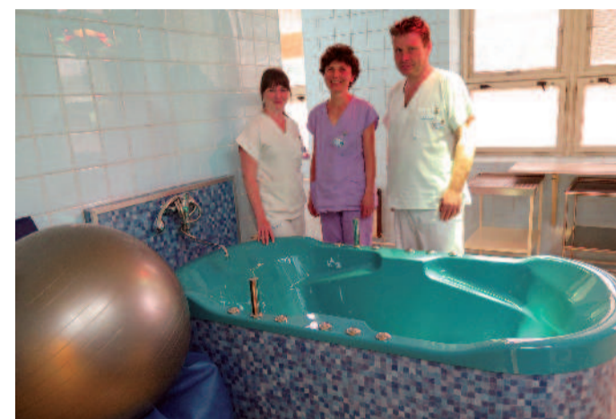
PORODNÍ VANA. Teplá voda je balzámem na porodní bolesti, do vody je možné také porodit, ale to už má určité nevýhody.

Otcové ji absolvují, chodí na kurzy společně s maminkami. A je to pak u porodu opravdu poznat. Když projdou přípravou, vědí, co mají očekávat a jsou pou-