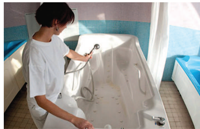
VODOLÉČBA. Prostory budou brzy jako nové.

korun. Rekonstrukce je naplánovaná na červenec a srpen. To je pro tento účel jediné vhodné období, neboť během dovolených je nejméně rehabilitací. Rehabilitační oddělení je ovšem hodně vytiženo. Kromě vodoléčby obsahuje také tělocvičnu a několik rehabilitačních místností. Ty si na rekonstrukci ještě budou