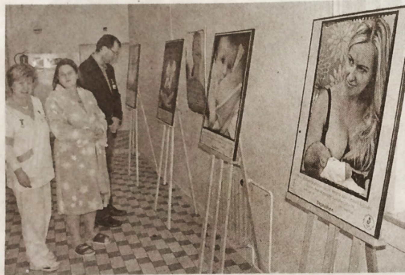
S DOBOU se v Krumlově snaží jít i ve stylu doprovodných akcí a výstav v nemocnici.

Novinku má i chirurgické oddělení nemocnice, takzvanou pooperační místnost: „V pooperační místnosti doznívá pod dohledem lékařského personálu anestezie pacienta. Tento prostor byl rekonstruován kompletně, tedy včetně přístrojového vybavení, které patří k nejmodernějším,“ doplňuje primář chirurgického