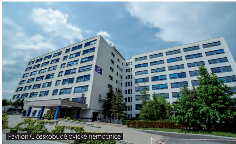
Pavilon C českobudějovické nemocnice