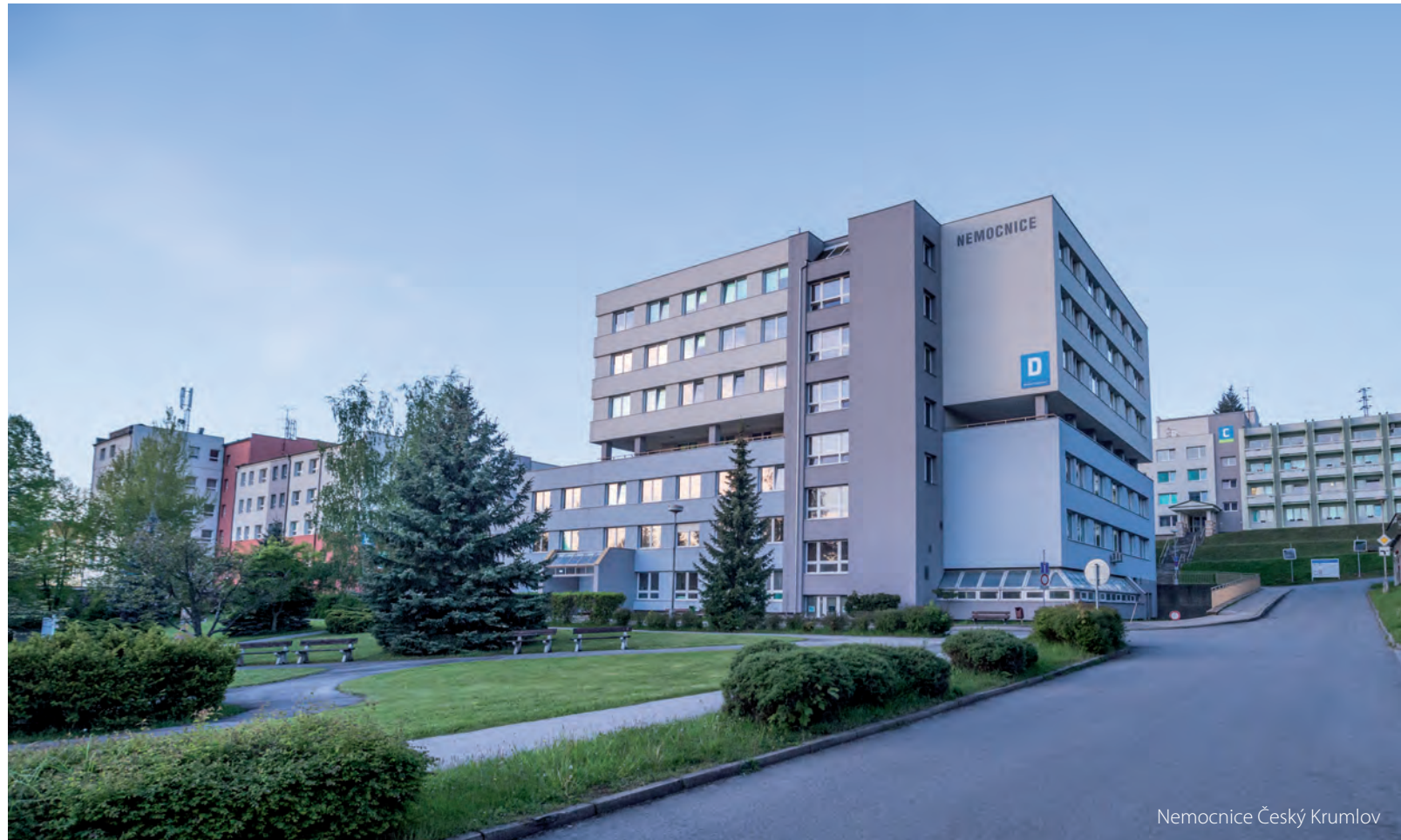
Nemocnice Český Krumlov

Českokrumlovská nemocnice chystá pro letošní rok zahájení výstavby nového multifunkčního pavilonu. Přestěhují se do něj Gynekologicko–porodnické oddělení, Dětské oddělení, urologická ambulance, onkologická ambulance nebo třeba ředitelství, ale i řada dalších pracovišť. Základní kámen by měl být, pokud vše půjde podle plánu, položen v září.