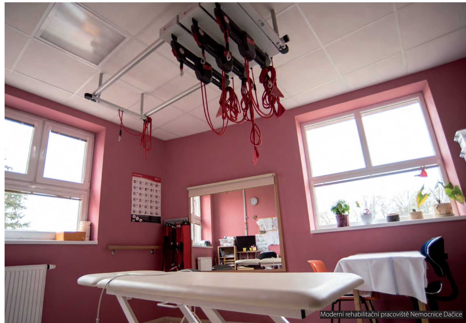
Moderní rehabilitační pracoviště Nemocnice Dačice

Téměř v sousedství s Krajem Vysočina se nachází Nemocnice Dačice. Ta je sice nejmenší jihočeskou nemocnicí, ale co do služeb nabízených pacientům tomu tak není. Do areálu se sem jezdí rehabilitovat lidé po endoprotézách kolenních a kyčelních kloubů, po úrazech, cévních mozkových příhodách a podobně. Mají zde totiž nejmodernější vybavení pro úspěšnou rehabilitaci a rekonvalescenci.